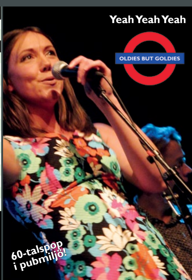
Yeah Yeah Yeah