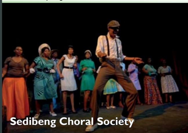
Sedibeng Choral Society