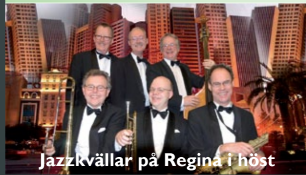
Jazzkvällar på Regina i höst