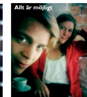
Allt är möjligt