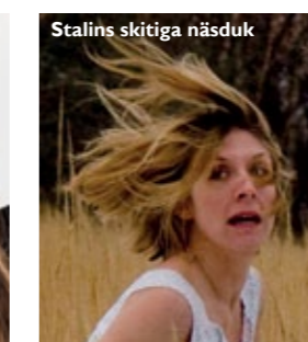
Stalins skitiga näsduk

Gå på restaurang i samband med ditt teaterbesök!