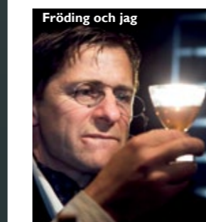
Fröding och jag

Reginateaterns populära luncher fortsätter på onsdagar, torsdagar och fredagar. Kom och krydda din lunch med ett spännande drama, en komedi eller en portion underbar musik i trevligt sällskap. I lunchen ingår en god vegetarisk hemlagad soppa, bröd & ost och kaffe & kaka. Under hösten blir det direktsänd musik genom P4 Lajv!