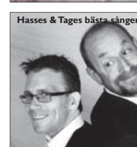
Hasses & Tages bästa sånger