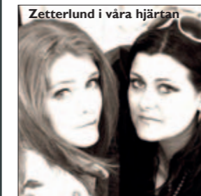
Zetterlund i våra hjärtan

Under våren blir det direktsänd musik genom P4 Lajv!